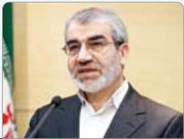
مهر نائید شورای نگهبان بر طرح ضدبَر جامی مجلس

پس از انتشار اخباری درباره علت تشدید بیماری آیت‌الله محمدتقی مصباح یزدی و اعلام ابتلای وی به کرونا، دفتر رییس موسسه آموزشی و پژوهشی امام خمینی اطلاعیه‌ای صادر کرد. به گزارش اسکناس، متن این اطلاعیه به شرح زیر است: «در پی انتشار خبر بیماری حضرت آیت الله مصباح یزدی (دام ظلّه العالی)، شایعات و اخبار نادرستی در این باره منتشر شده که موجب نگرانی دوست‌داران معظم له شده‌است. ضمن تأکید بر این‌که تنها منبع موق اخبار صحیح در این باره، پایگاه‌های اطلاع‌رسانی آثار آیت الله مصباح به نشانی MESBAHYAZDI.IR می‌باشد، به اطلاع می‌رساند مشکل ایشان ضعف مغزط جسمانی به دلیل ادامه و تشدید بیماری گوارشی است و در منزل تحت مراقبت پزشکی هستند. در انتها بار دیگر از همه علاقه‌مندان درخواست دعا و توسل برای شفای کامل و عاجل ایشان داریم.»