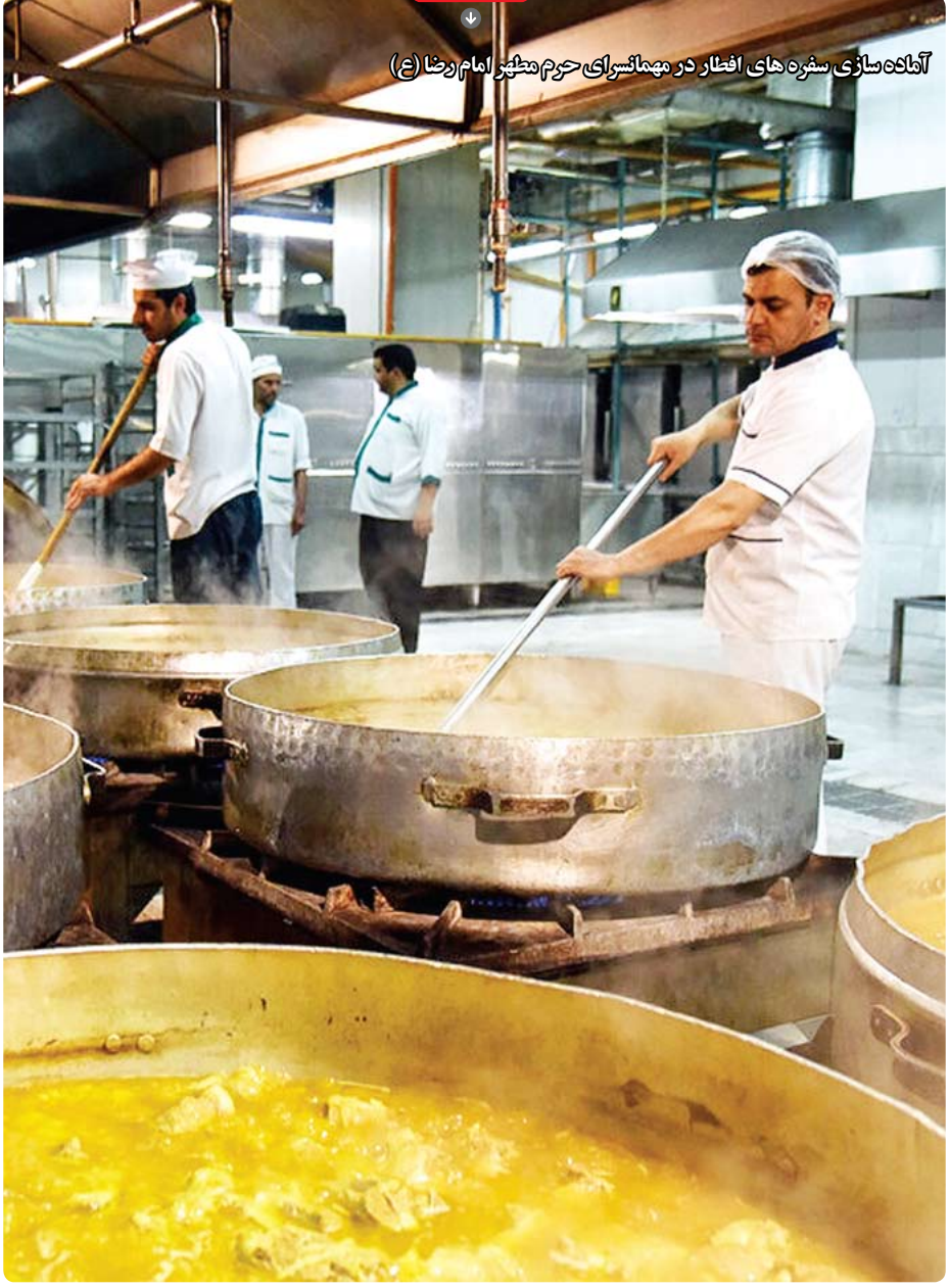
آفاده‌سازی سفره‌های افطار در مهمانسرای حرم مطهر امام رضا (ع)