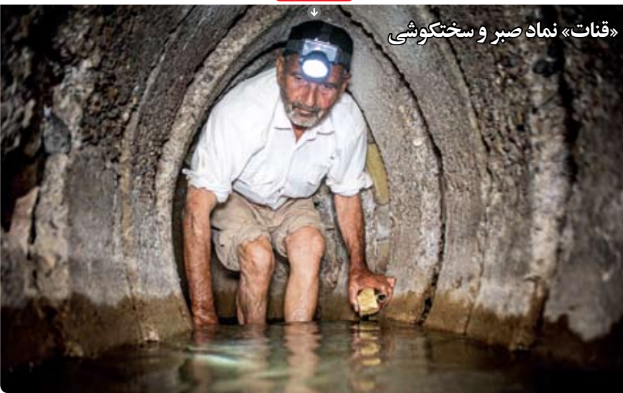
«قنات» نماد صبر و سختکوشی