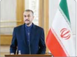
۲ بار حامل پیام