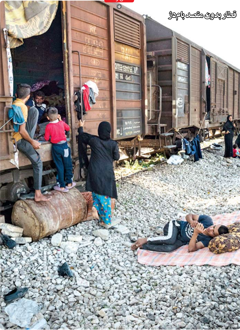
■ عکس: باشگاه خبرنگاران جوان