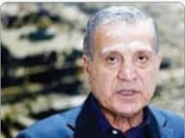
مر حله جدیدی

رئیس جمهور ترکیه در دیدار با همتای مصری خود از افزایش سطح روابط دو کشور در آینده خبر داد. به گزارش خبرگزاری فارس، «رجب طیب اردوغان» رئیس جمهور ترکیه می‌گوید در دیدار با «عبدالفتاح السیسی» رئیس‌جمهور مصر توافق شده که باز دیدهایی در سطح وزرا میان دو کشور انجام شود و سپس سطح دیدارها بالاتر برود. اردوغان بیان اینکه باالسیسی حدود ۴۵ دقیقه دیدار کرده، گفت این دیدار با وساطت «تمیم بن حمد آل ثانی» امیر قطر انجام شده و دو طرف توافق کرده‌اند که به بن بست ۹ ساله در روابط پایان دهند. وی در ادامه اضافه کرد: «به رئیس جمهور مصر گفتیم که آنکارا اعلام‌قصد است اختلافات میان دو کشور پایان یابد». روابط دیپلماتیک بین آنکارا و قاهره در سال ۲۰۱۲ و به دنبال کودتای عبدالفتاح السیسی، رئیس‌جمهوری کنونی مصر علیه «محمد مرسى» رئیس‌جمهور سابق این کشور قطع شد. دیدار میان رجب طیب اردوغان رئیس‌جمهور ترکیه و عبدالفتاح السیسی در حاشیه افتتاحیه بازی‌های جام جهانی انجام شده بود.