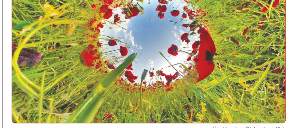
شقایق‌های دل انگیز «قره داغ»