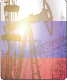
حمل و ویژه