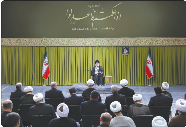
حضرت آیت الله خامنه‌ای در دیدار با مسئولان قوه قضاییه

رهبر معظم انقلاب اسلامی صبح دیروز در دیدار با مسئولان قوه قضائیه، «حل و فصل مسائل و اختلافات مردم بر اساس عدالت» و «جلوگیری از عبور از خط قرمز قانون» را از مسئولیت‌های اصلی دستگاه قضا برشمردند و افزودند: مهم‌ترین وظیفه دستگاه قضایی اجرای شجاعانه و بدون ملاحظه عدالت است.