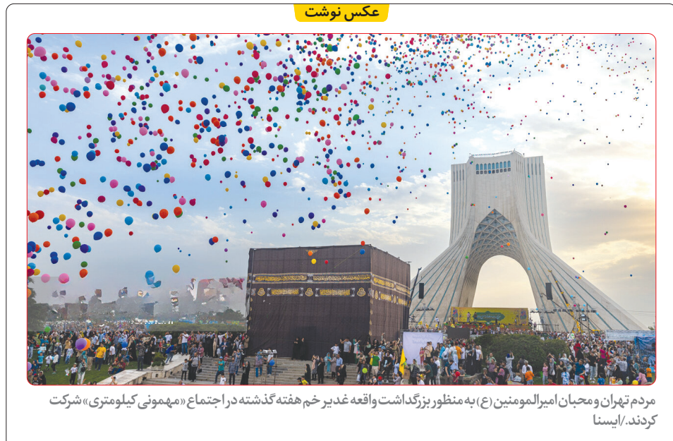
مردم تهران و محبان امیرالمومنین (ع) به منظور بزرگداشت واقعه غدیر خم هفته گذشته در اجتماع «مهمونی کیلومتری» شرکت کردند.