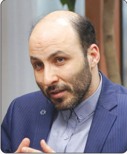
معاون بانک مرکزی: