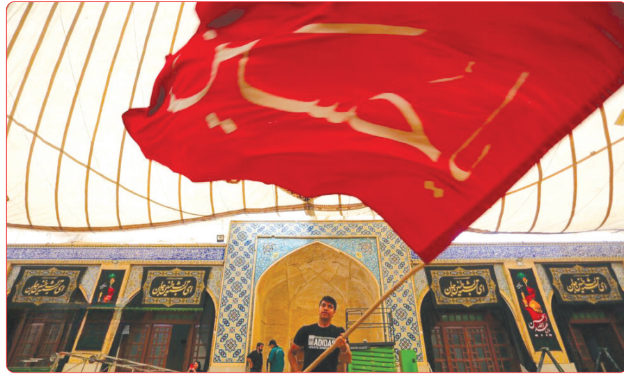
برافراشتن خیمه ۴۰۰ ساله هاوونیه در اصفهان