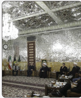
تولیت آستان قدس رضوی:

دولت جدید برای تقویت فرهنگ دینی به «زیارت» توجه جدی داشته باشد