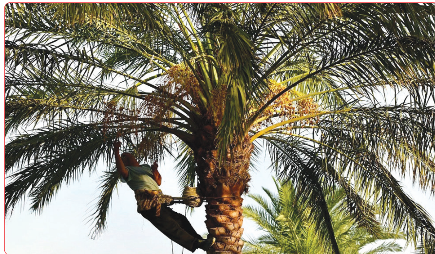
برداشت ژلب در فصل خرمایران خرمشهر/ فارس