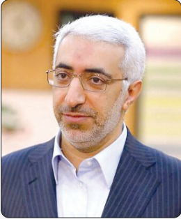
رئیس سازمان بورس: