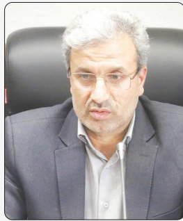
مدیر کل تعاون استان خبر داد: