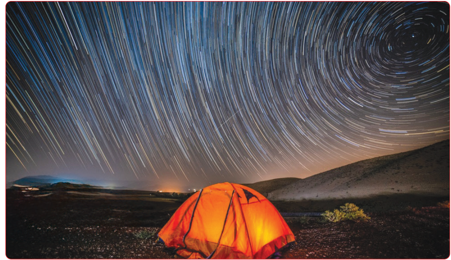
بارش شهابی پرساوشی