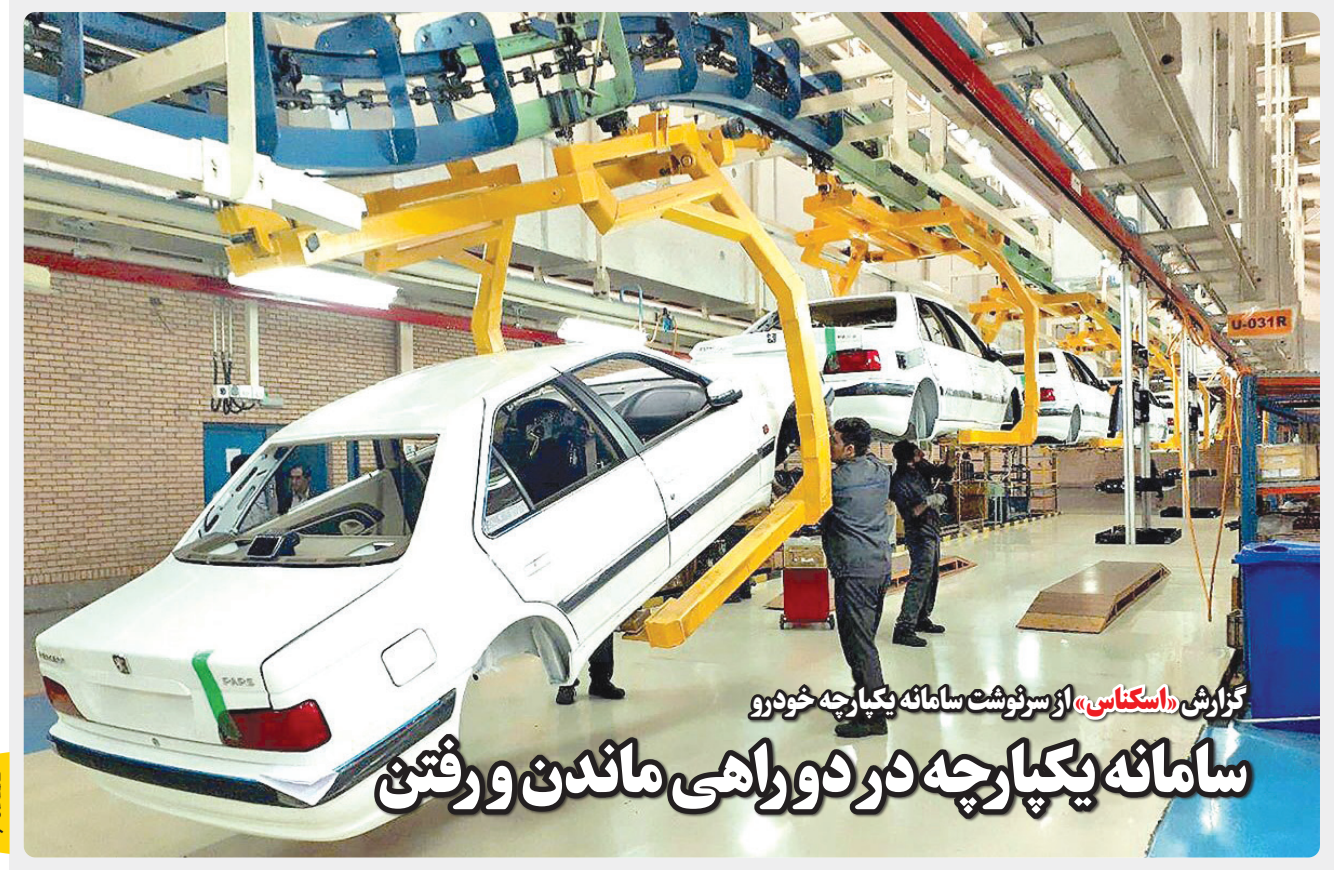
گزارش «اسکناس» از سرنوشت سامانه یکپارچه خودرو