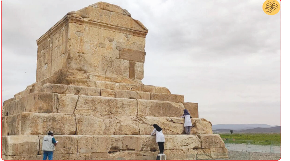
مرمت و استحکام بخشی آرامگاه کوروش بزرگ