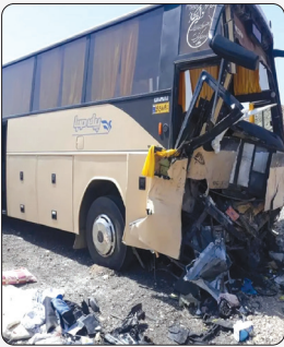
مدیر کل مدیریت بحران سازمان حمل و نقل جاده‌ای: