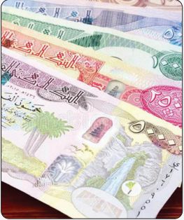
بانک مرکزی اعلام کرد: