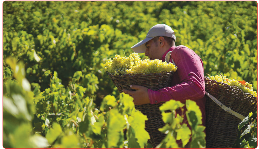
برداشت انگور برای تولید کشمش به روش سنتی «پولو» در استان کردستان