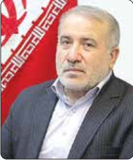
عضو کمیسیون عمران مجلس: