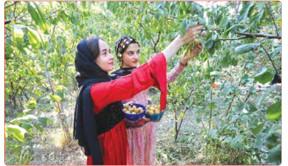
جستواره آلود در روستای حیدره قاضی‌خان بهار فارس