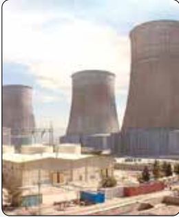
نیروگاه اتمی بوش در تگزاس، آمریکا