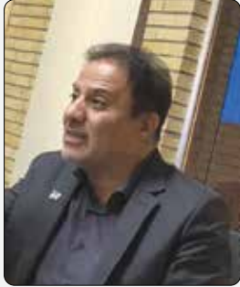
در جشنواره شهید رجایی رخ داد؛