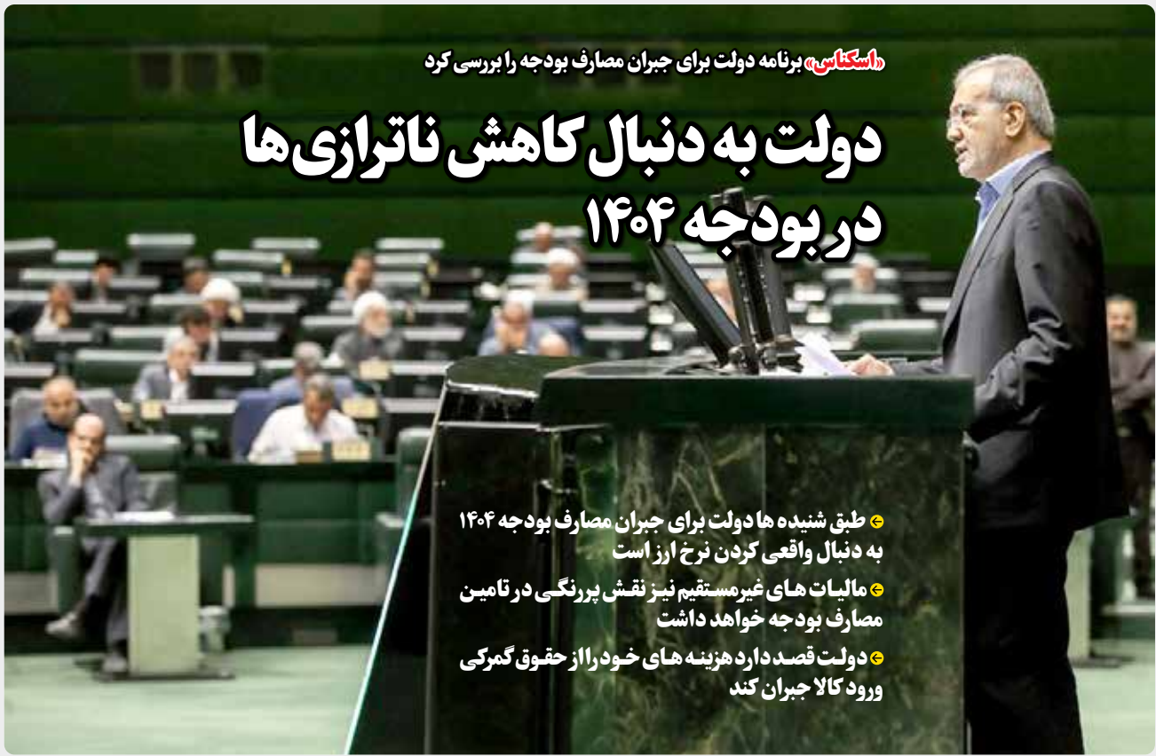
استکناس: برنامه دولت برای جبران مصارف بودجه را بررسی کرد