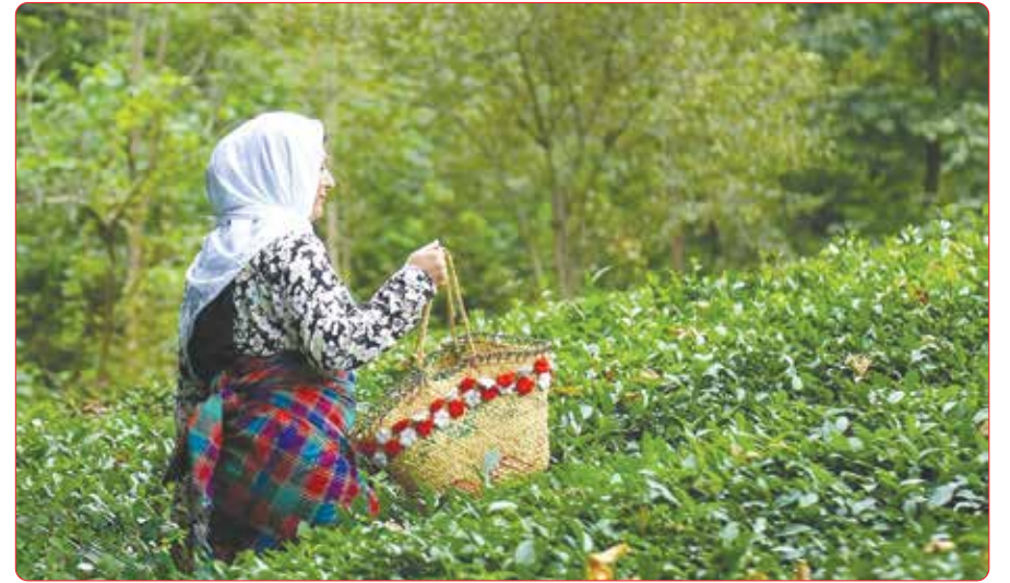
برداشت چای در مازندران