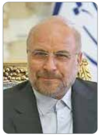
رئیس مجلس خبر داد: