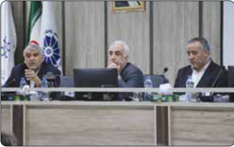
رئیس اتاق بازرگانی استان سمنان :