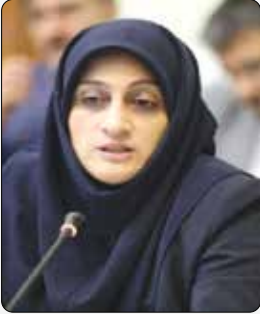
سخنگوی ستاد بودجه: