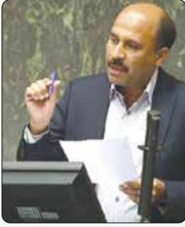
نماینده مجلس در جریان جلسه علنی