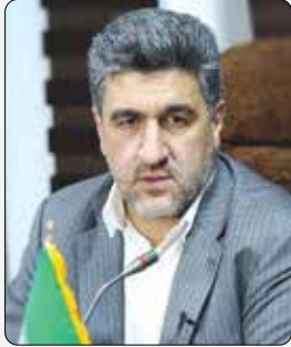
رییس سازمان بورس عنوان کرد: