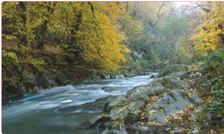
پاییز چشم نواز جنگل‌های هیرکانی