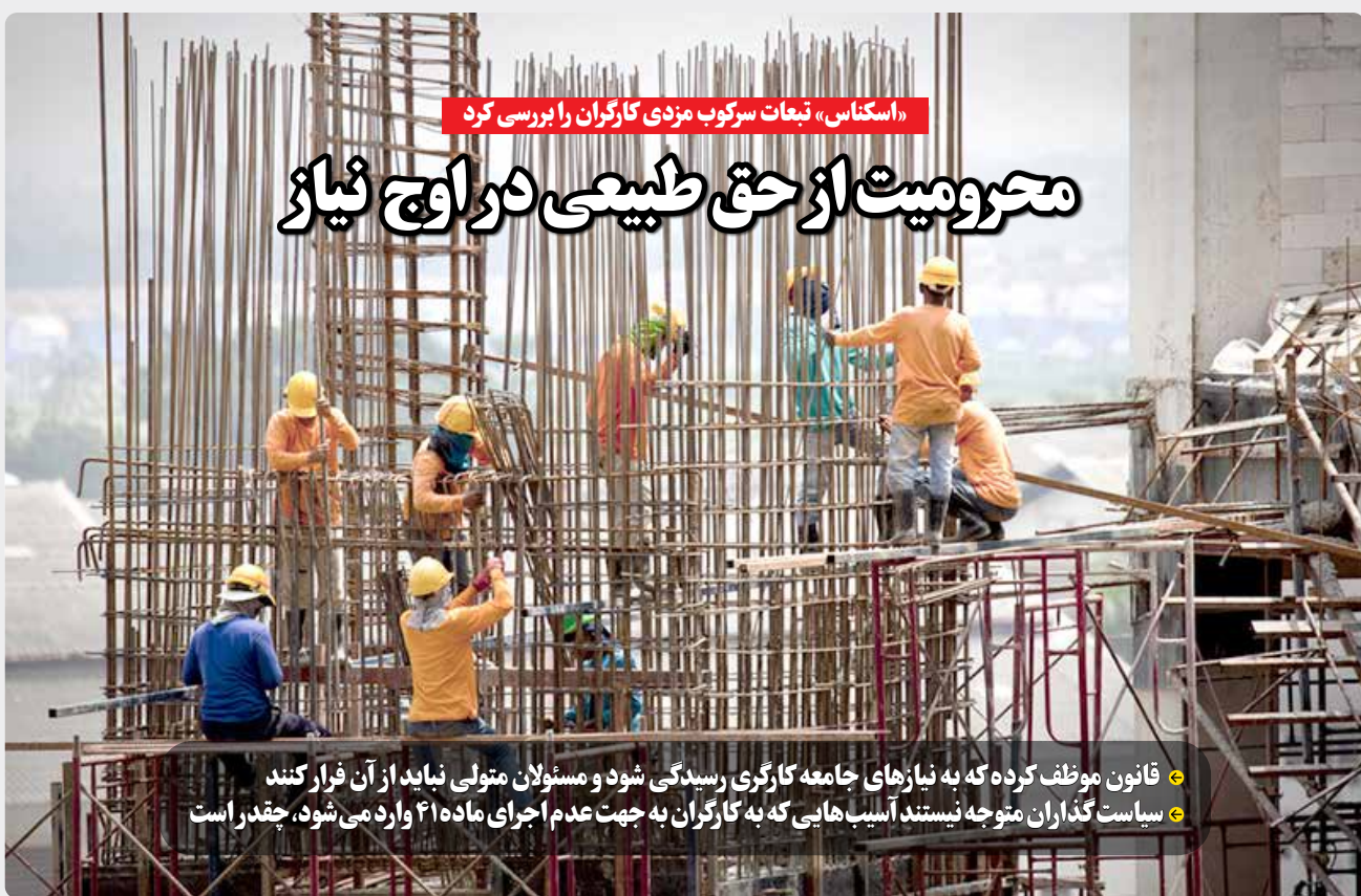
«استکناس» تبعات سرکوب مزدی کارگران را بررسی کرد