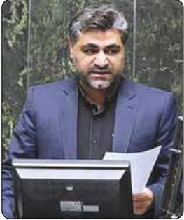
عضو کمیسیون انرژی مجلس