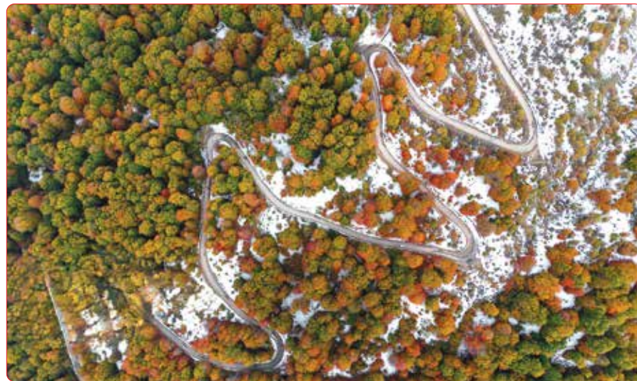
جادوی پاییز در مازندران: پرده‌ای از هزار رنگ