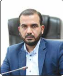
عضو کمیسیون تلفیق: