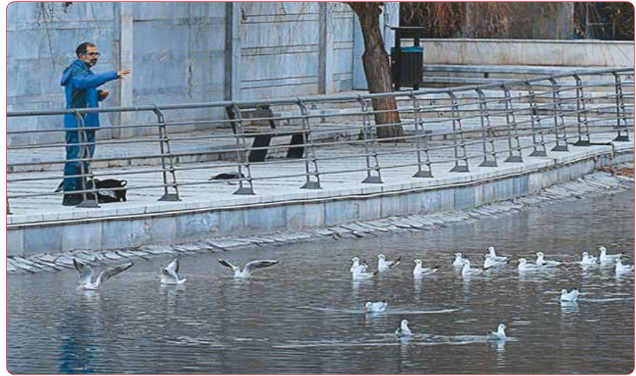
کوچ پرندگان مهاجر به تهران/ فرارو