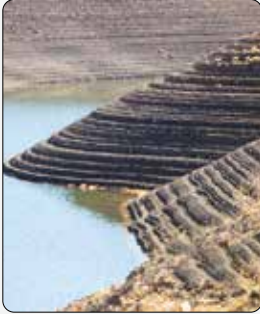
آب در بند

مدیرعامل شرکت مهندسی آب و فاضلاب کشور خبر داد: