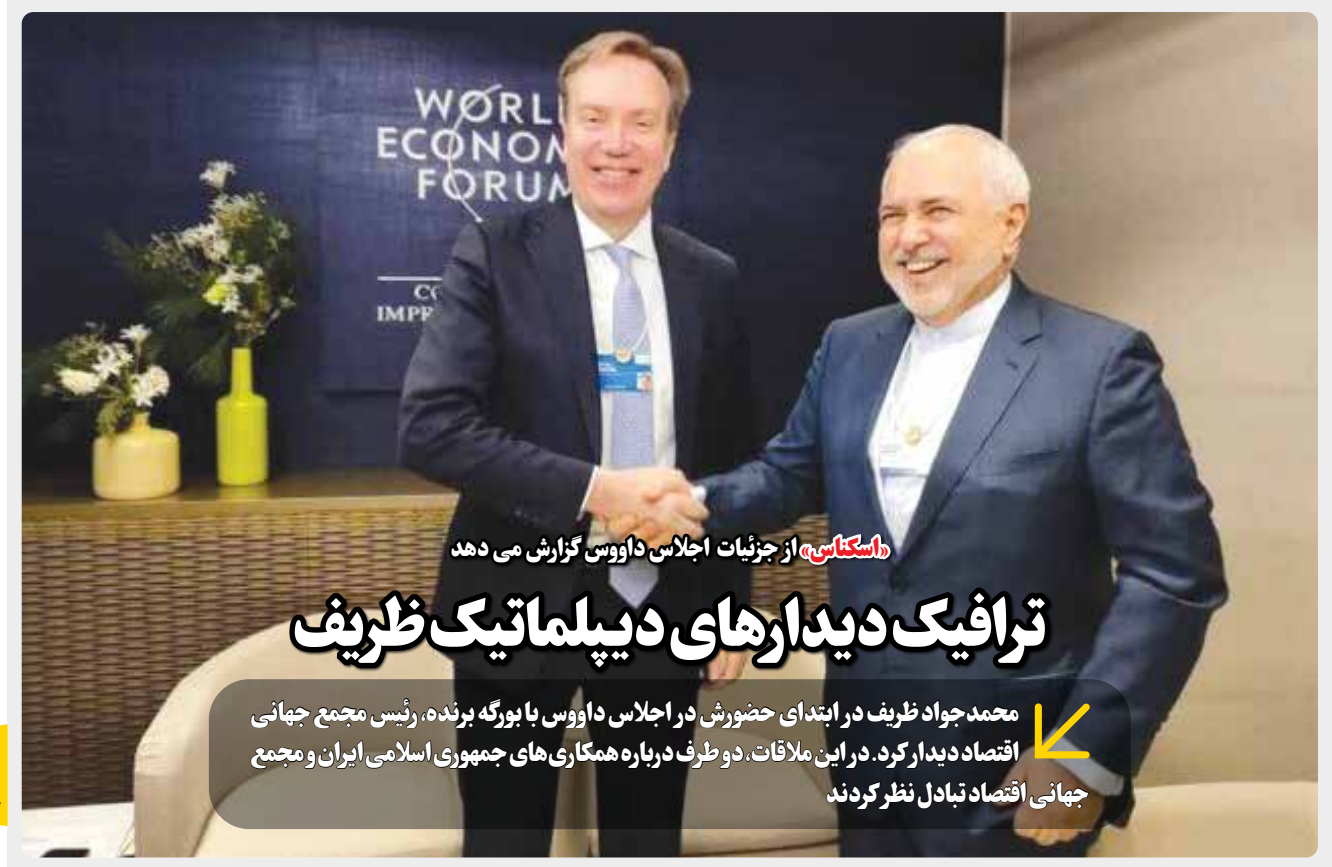
«استکناس» از جزئیات اجلاس داووس گزارش می‌دهد