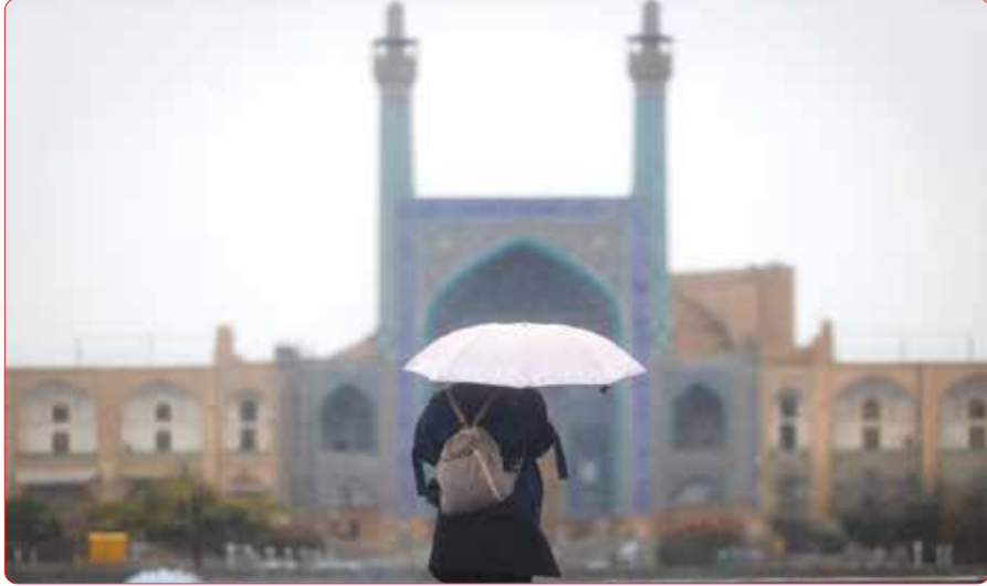
روز بارانی اصفهان/ایمانا

صاحب امتیاز: سجاد ملک مدیر مسئول: وحید ملک زیر نظر شورای سردبیری تلفن: ۴۳۲۷۳۸۳ - ۴۳۲۴۶۸۵ - ۴۴۲۵۷۹۱۵ آدرس: تهران - بلوار شهران - نبش خیابان قدس - پلاک ۲ - ساختمان افرا پتیه ۴ - واحد ۴۵ کدپستی: ۱۴۷۴۹۳۱۹۷۴ ایمیل: Eskenasnewspaper@gmail.com آدرس سایت: eskenasnewspaper.com