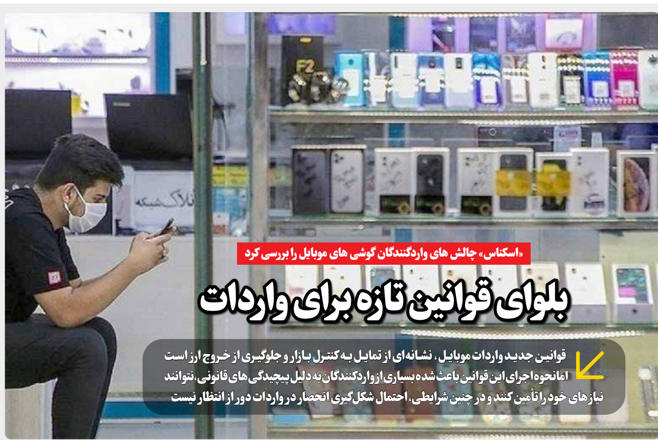
«استکنا س» چالش های واردکنندگان گوشی های موبایل را بررسی کرد