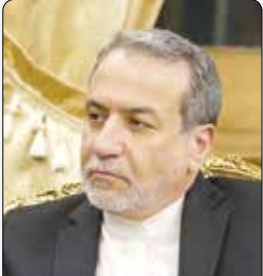
وزیر امور خارجه

وزیر امور خارجه ایران به ابراز تمایل رئیس‌جمهور جدید آمریکا برای توافق با ایران واکنش نشان داد.