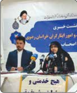
مدیر کل بنیاد شهید و امور ایثار گران استان خبر داد :