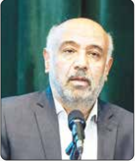
وزیر کار خیر داد: