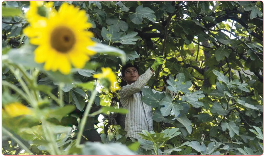
گلگاه: شهر انجیرهای ایران