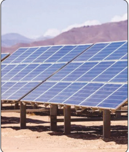
طی دو سال اخیرصورت گرفت: