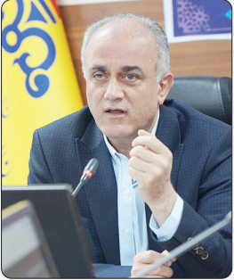
مدیر عامل شرکت گاز مازندران