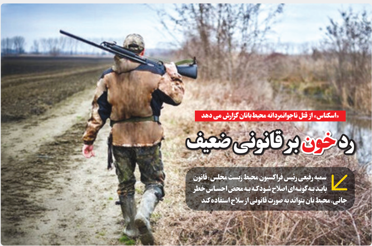
«استکنا س» از قتل ناجوانمردانه محیط بانان گزارش می دهد