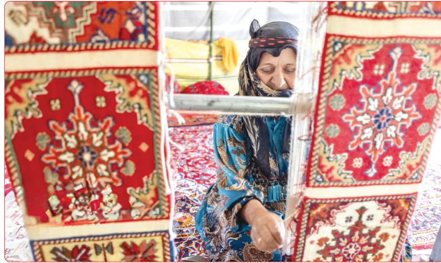
کوچ بیلاقی عشایر قاراداغ/ایرنا