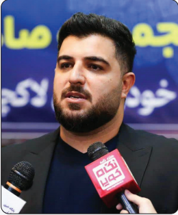
شهر دار بهارستان