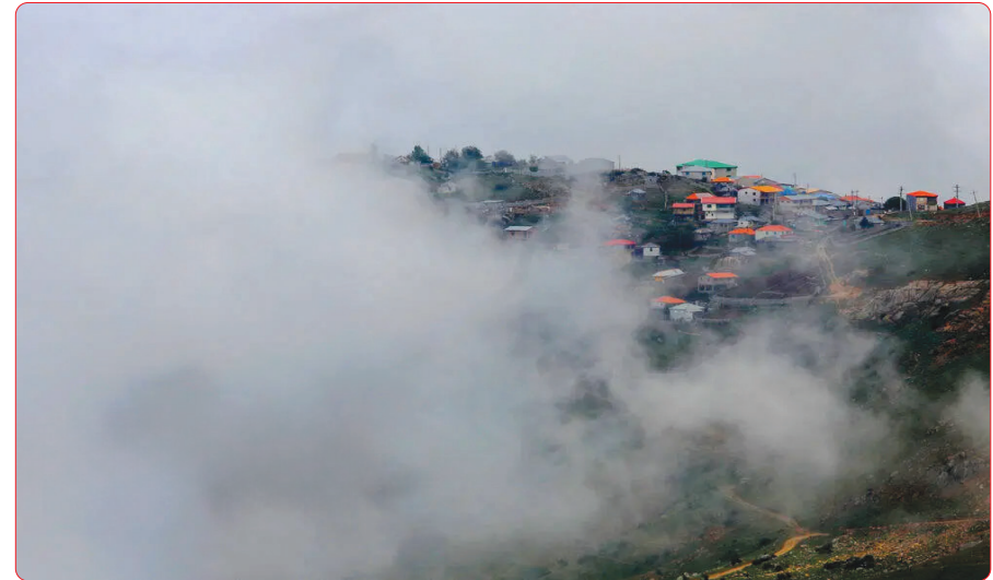
روستای «اسپوز» سوادکوه پر فراز ایروها