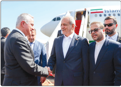
وزیر امور خارجه ایران، محمدجواد ظریف، در جریان سفر به ارمنستان با نخست‌وزیر ارمنستان، نیکول پاشینیان، در فرودگاه ایروان.

یک قدرت منطقه‌ای تاثیرگذار و ثبات سوق داده است. همه این موارد گواه آن است که مناسبات دو کشور در حوزه‌های متعدد سیاسی، فرهنگی، اقتصادی و حتی امنیتی ظرفیت‌های زیادی برای گسترش داشته و این مهم در دستور کار مقامات دو کشور قرار گرفته و چنان‌که ذکر آن رفت یکی از اهداف سفر رئیس جمهور نیز به حساب می‌آید.