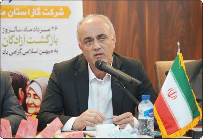
موفق و سربلند باشیم.