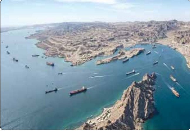
تانکرهای نفتی در تنگه هرمز