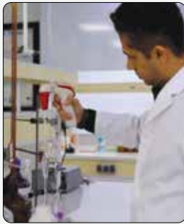
در سال گذشته صورت گرفت؛