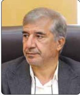
عضو کمیسیون اقتصادی مجلس: