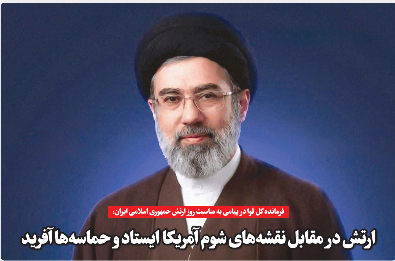
فرمانده کل قوا در پیامی به مناسبت روز ارتش جمهوری اسلامی ایران: