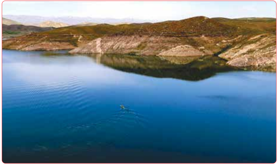
وضعیت آبی سد طرق مشهد