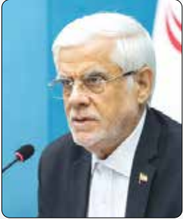
معاون اول رئیس جمهوری؛

معاون اول رئیس‌جمهوری بر ضرورت حفظ ثبات اقتصادی تأکید کرد و گفت: باید فشار اقتصادی بر مردم و کسب‌وکارها به حداقل برسد و سرعت تصمیم‌گیری دستگاه‌های اقتصادی افزایش یابد. محمد رضا عارف در ادامه جلسات هماهنگی دولت برای مدیریت پیامدهای جنگ، با وزیر علوم، وزیر اقتصاد و رؤسای سازمان حفاظت محیط زیست و استانداران دیدار و گفت‌وگو کرد. در این دیدارها، مسئولان دستگاه‌های مختلف گزارشی از خسارات وارد شده و برنامه‌های اجرایی خود ارائه دادند و معاون اول رئیس‌جمهوری نیز بر هماهنگی بین‌نهادی و تسریع اقدامات تأکید کرد. علی مدنی‌زاده وزیر امور اقتصادی و دارایی گزارشی از اقدامات انجام شده در حوزه‌های مالیاتی، گمرکی و بانکی ارائه کرد که در آن به تویق برخی ضمانت‌نامه‌های گمرکی، حمایت مالیاتی از بنگاه‌های کوچک و متوسط، تسریع