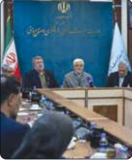
معاون اول رئیس‌جمهور با تأکید بر نقش تعیین‌کننده مردم در عبور از جنگ‌ها و بحران‌ها، نسبت به افزایش‌های ناگهانی قیمت‌ها هشدار داد و خواستار برخورد قاطع با سوءاستفاده‌کنندگان شد.

دشمن به دنبال عملیات روانی و مهندسی آن به‌گونه‌ای است که مردم را از اعتماد به عملکردهای دولت سلب کند. شاهد بودیم در جنگ چون مردم از شرایط ذخیره کالا اطمینان داشتند، تاب‌آوری وجود داشت و رسانه‌ها شفاف‌سازی می‌کردند، مردم توجهی به ادعاهای دروغین دشمن نداشتند و کالاها و توزیع آنها در کشور به خوبی انجام شد و کمبودی احساس نشد.