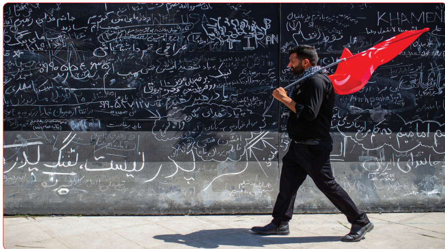
در حاشیه آیین وداع با رهبر شهید انقلاب، زائران با نگارش جملات، دعاها و پیام‌های کوتاه بر دیوارهای مصلاهی تهران، احساسات و ارادت خود را به یادگار گذاشتند.