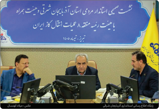
پیکانه، اطلاع‌رسانی استاندار آذربایجان شرقی

مدیر منطقه ۸ عملیات انتقال گاز ایران اظهار داشت : کارکنان این منطقه عملیاتی با حضور شبانه‌روزی،